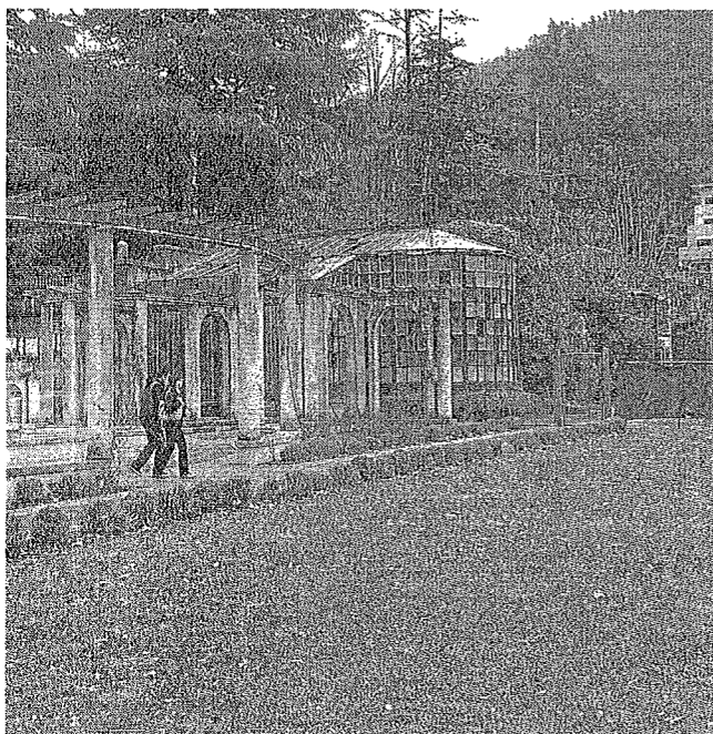
L'area delle serre della Favorita individuata per la biblioteca. L.CRI.