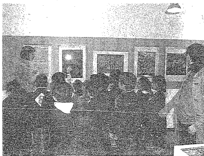
Bambini durante una mostra prevista nell'ambito del progetto. VE.MO.

mente dalla trevigiana Sarmade, con 70 opere esposte di 46 artisti provenienti da 18 Paesi, ha registrato oltre 2 mila visitatori». L'esposizione in galleria civica era collegata a quella in galleria dei Nani con "Animali fantastici e l'esercito di Pawlonia" di Silvana Battistello, che ha visto anche «l'organizzazione di due laboratori con 60 partecipanti - ha spiegato ancora Benetti - Come ormai da tradizione c'è la collaborazione con le scuole elementari e medie: le rassegne teatrali in collaborazione con La Piccionaia-I Carrara hanno coinvolto più di mille 500 studenti».